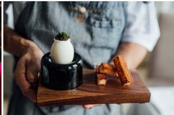
Le Hatley