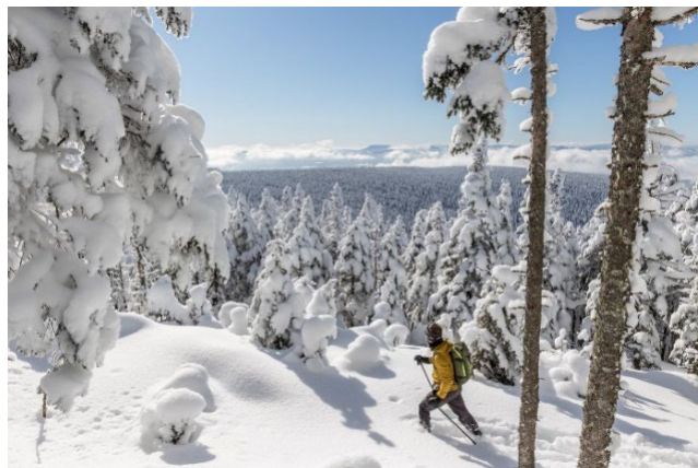
Parc national du Mont-Mégantic- Crédit : Mathieu Dupuis, Google Voyages

Pour plus de suggestions : Hébergement | Auberge, hôtel, chalet, gîte B&B, camping | Cantons-de-l'Est (Estrie)