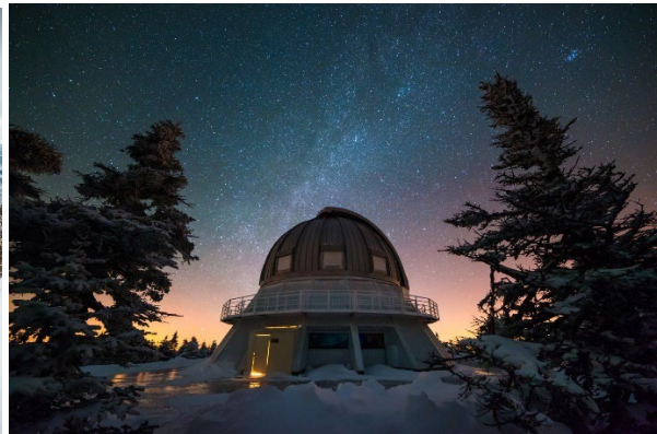
ASTROLab, PNMM - Crédit : Rémi Boucher - Tourisme Mégantic

Cet hiver, la luge autrichienne sera de retour au parc national du Mont-Mégantic , pour allier plaisir et exercice. Les quatre parcs nationaux et deux parcs régionaux des Cantons-de-l'Est permettent de profiter d'une panoplie d'activités pendant la saison froide.