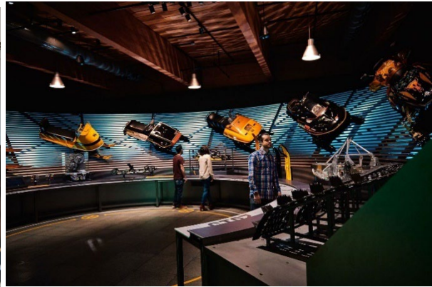
Musée de l'ingéniosité J.A. Bombardier