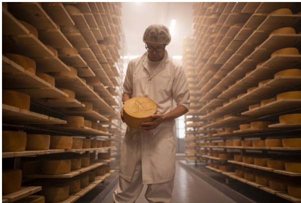
Fromagerie La Station

primés. La région est également riche en cidreries et en distilleries , offrant une dizaine de lieux accueillants où savourer des produits locaux uniques.