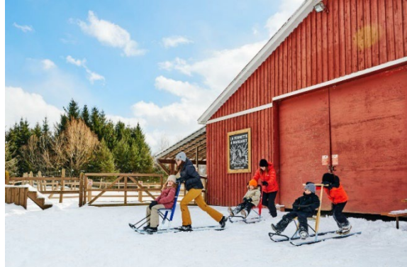
Trottinette des neiges