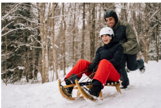
Luge autrichienne - Crédit : SÉPAQ

Le Parc de la Gorge de Coaticook offre 17 kilomètres de sentiers de vélo à pneus surdimensionnés ( fatbike ) pour les amateurs de deux roues, le tarif d'entrée inclut également l'accès à la patinoire. Les familles pourront découvrir une activité hivernale hors du commun : la trottinette des neiges , une tradition scandinave qui gagne en popularité au Québec.