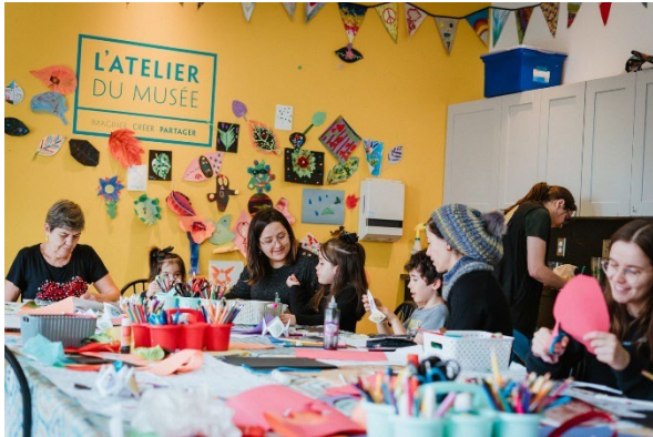
MBAS- Crédit : Jean-Michel Nault

Pour plus de suggestions : 10 musées qui valent le détour dans la région | Cantons-de-l'Est