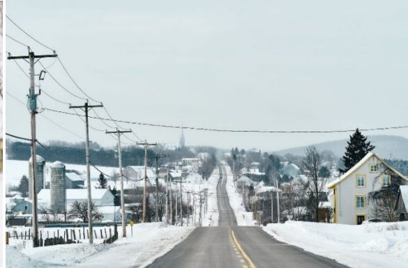
Cœur villageois de Lambton - Crédit : Daphné Caron