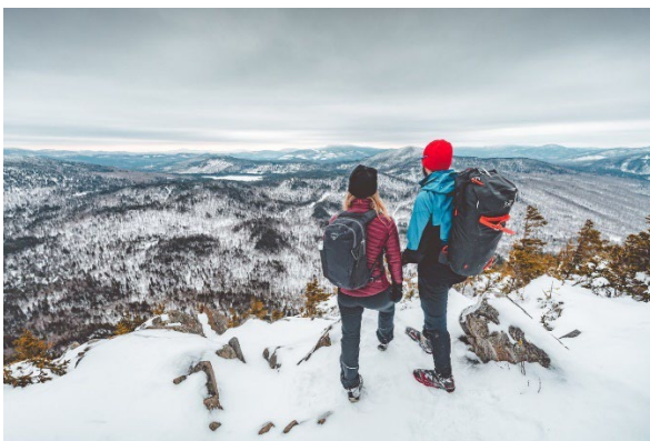
Montagne de Marbre

Les Sentiers de l'Estrie et les Sentiers frontaliers , notamment le Mont Gosford figurent parmi les cinq meilleurs sites de randonnée hivernale au Québec. Il ne faut pas rater les fameux fantômes de neige du parc national du Mont-Mégantic , un phénomène spectaculaire. L'ASTROLab du parc national du Mont-Mégantic propose également des soirées d'astronomie hivernales tous les samedis à partir du 25 janvier. Levez les yeux au ciel pour admirer les étoiles dans la toute première réserve internationale de ciel étoilé.