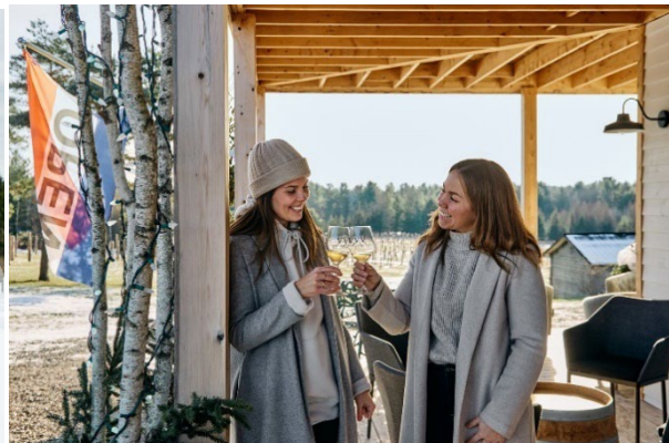
La Route des vins

Les amateurs de bières artisanales peuvent explorer la trentaine de microbrasseries des Brasseurs des Cantons , où chaque établissement met en valeur le terroir local à travers des créations distinctives. Pour les amateurs de fromages, le Circuit des Têtes Fromagères rassemble une quinzaine de fromageries artisanales reconnues pour leurs fromages fins