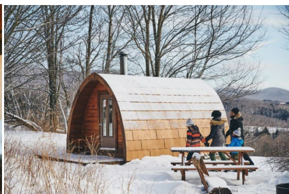
Au Diable Vert

Les amateurs d' hébergements insolites n'ont pas à chercher loin, les Cantons-de-l'Est regorgent d'expériences. À Bury, les chalets flottants Bora Boréal annoncent un séjour écotouristique des plus agréables. Chez Les Loges à Stanstead, les visiteurs auront l'occasion de vivre une expérience thermale privée; sauna, spa et hammam en pleine nature. Alors que les chalets sur pilotis de Laö Cabines à Racine promettent un cadre naturel hors du commun,