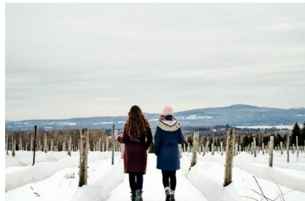
La Route des vins de Brome-Missisquoi