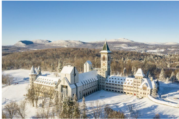
Abbaye St-Benoit-du-Lac