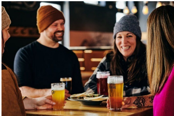
Sutton Brouërie

Pour plus de suggestions : Des plats réconfortants à s'offrir au restaurant | Cantons-de-l'Est (Estrie)