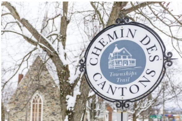
Chemin des Cantons

Le Chemin des Cantons offre une expérience hivernale unique, plongeant les visiteurs au cœur de l'histoire captivante des Cantons-de-l'Est. Elle sillonne des villages charmants, des édifices patrimoniaux et des panoramas saisissants, reflets de l'héritage laissé notamment par les Loyalistes, Irlandais et Écossais. Au-delà de son attrait historique, l'itinéraire propose une immersion culturelle riche à travers musées, galeries d'art et autres joyaux patrimoniaux. Cette route permet de s'imprégner de l'essence de la région, même en hiver.