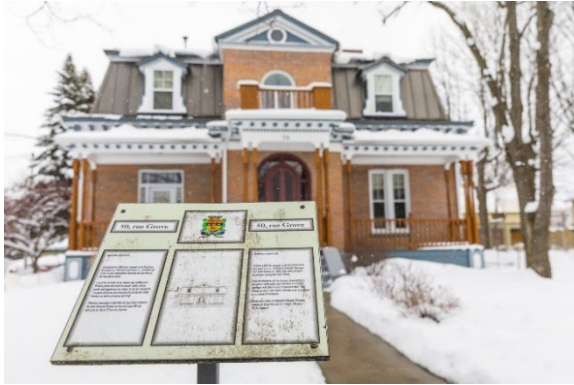
Danville - Crédit : Mathieu Dupuis

Une autre façon de découvrir la région, c'est à travers l'exploration des dix Cœurs villageois des Cantons-de-l'Est, qui mettent en valeur le riche patrimoine architectural et les incomparables décors de la région. Les visiteurs peuvent par exemple explorer Dunham , ses bâtiments historiques et manger à la table fermière de la Brasserie Dunham . À Danville , le savoir-faire des artistes d'ici est à l'honneur avec ses nombreuses galeries d'art, alors que l'Étang Burbank , paradis des ornithologues, propose quatre kilomètres de sentiers aménagés pour se dégourdir les jambes.