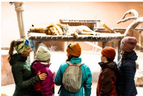
Zoo de Granby

Avec ses centres d'amusement , et ses attraits intérieurs captivants , la région offre une multitude d'options pour créer des souvenirs inoubliables en famille, peu importe la température. Le Zoo de Granby permet aux visiteurs de découvrir une variété d'animaux adaptés au climat froid, tels que les tigres de l'Amour, les léopards des neiges et les petits pandas, évoluant dans un décor féérique. Pour se réchauffer, plusieurs pavillons intérieurs sont accessibles, abritant des espèces exotiques comme les éléphants et les girafes. Pour les plus sportifs, le Centre national de cyclisme de Bromont , un attrait unique au Québec, permet de prolonger la saison de vélo à l'abri des intempéries grâce à son vélodrome, ses pistes à rouleaux ( pumptrack ), et sa zone de freestyle.