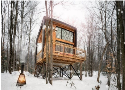
Laö Cabines

pour se ressourcer. Finalement, Mi-Clos , ces dômes éco-luxueux, sont un hébergement idéal pour une vue imprenable sur le mont Orford.